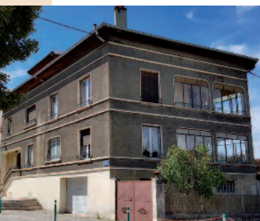
la maison côté rue

Ils disposent également d'une chambre d'amis pour accueillir leurs proches.