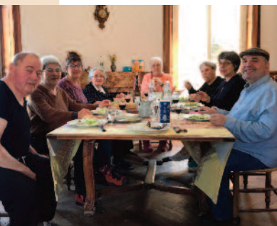
les repas pris en commun

selon les compétences de chacun (finances, administratif, communication, organisation d'évènements, activités dans la maison, etc.) - le Conseil d'Administration qui coordonne les actions, garantit l'esprit de la colocation, assure le suivi de la viabilité économique et sociale ainsi que les ajustements éventuels.