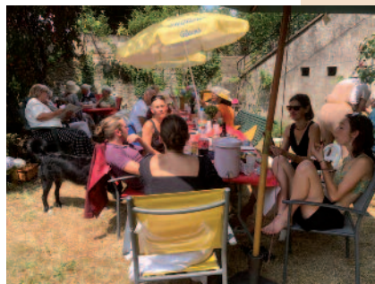
Concert et pique-nique dans le jardin