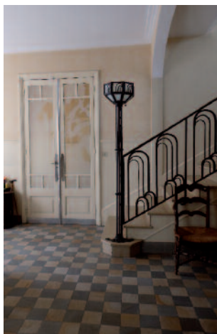
Le hall d'entrée art déco