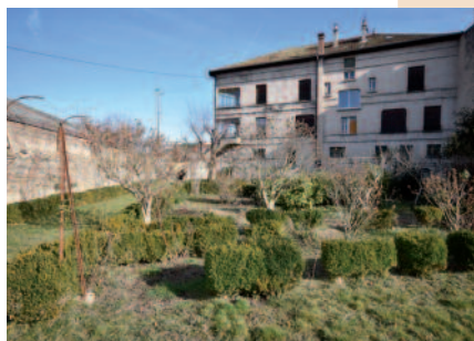
la maison côté jardin