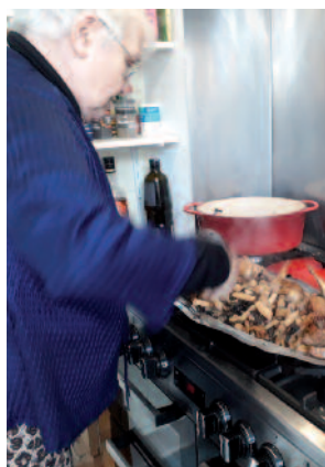
les bons petits plats mijotés ensemble